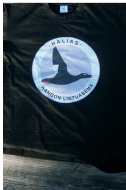
Halias-paitoja koristaa haahka (edellinen sivu) sekä Suomeen eksynyt suurharvinaisuus (yllä).