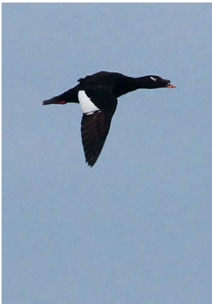
Oikea kyhmypilkkasiipi Melanitta deglandi näyttävässä ohilennossa. Huomaa takaosastaan ylöspäin kaartuva silmälaikku sekä Itä-Siperiassa pesivälle stejnegeri -alalajille ominainen selvästi kulmikas nokan kyhmy.