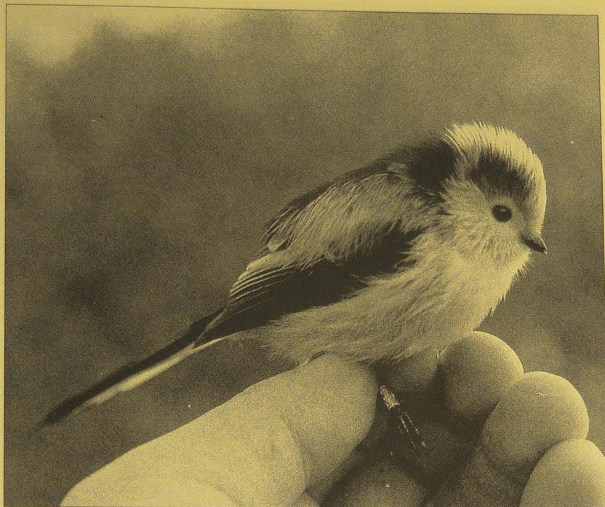
Pyrstöiaisia ( Aegithalos caudatus ) rengastettiin enemmän kuin koskaan aikaisemmin yhden syksyn aikana. Valkopäisten nimialalajin lintujen lisäksi joukkoon oli eksynyt Manner-Euroopassa pesivän europaeus -alalajin näköinen, tummasilmäkulmainen yksilö.

ainoastaan pyrstöiaisella oli voimakas, punatulkulla, sinitiaisella ja päihinähakilla kohtuullisen voimakas ja muilla keskinkertainen tai heikko vaellus. Pyrstöiaisia havaittiin 24.9.-15.11. välisenä aikana yhteensä 4040. Näistä 2383 yks. sai vierailunsa kunniksi renkaan jalkaansa. Parhaimmillaan niemellä seikkaili 13.10. 408, 16.10. 320 ja 17.10. 463 pyrstöiaista. Töyhtöiaisellakin oli jonkinlaista liikehdintää, siihen viittaa havaittujen (n. 150 yks.) ja rengastettujen (41 yks.) suuri määrä. Sinitiaisten koettelivat lukuisin joukoin rengastajien sormien kestävyyttä. Yli 8200 havaitusta 1140 jäi kiinni. Vilkkaimmat päivät ajoittuivat syys-lokakuun vaihteeseen: 24.9. 845, 26.9. 630, 29.9. 630 ja 6.10. 570 yks. Talitiaisten määrät jäivät selvästi sinitiaisesta; reilut 4600 havaittua ja parhaana päivänä, 9.10. vain 225 muuttavaa. Hömö- ja kuusitiaisten määrät olivat vain kalpea aavistus syksyn 1991 ryntäyksestä; hömötiaisia havaittiin kaikkiaan 630 ja kuusitiaisia reilut 2000 yks. syksyn -92 aikana. Lapintiaisia oli vähissä hömötiaisparvissa 3 yksilöä.