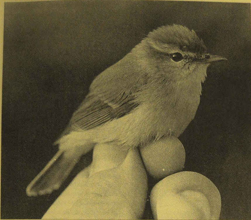
Haliaksen vuoden 1992 ainoa idänuunilintu ( Phylloscopus trochiloides ) törnäli verkkoihin kesäkuun 3. päivänä.

1.1.92. Meri oli kokonaan auki ja niemien rantavesissä uiskenteli mm. 75 sinisorsaa, 80 isokoskeloa, yksinäinen riskilä ja yhteensä parikymmentä kyhmyjoutsenta ja joutsenta. Pilkkasiipi viipotti määrätietoisena näköisenä merellä eteenpäin. Lämpimän alkutalven jäänteinä rannalta yhytettiin kaksi niitty-/luotokirvistä.