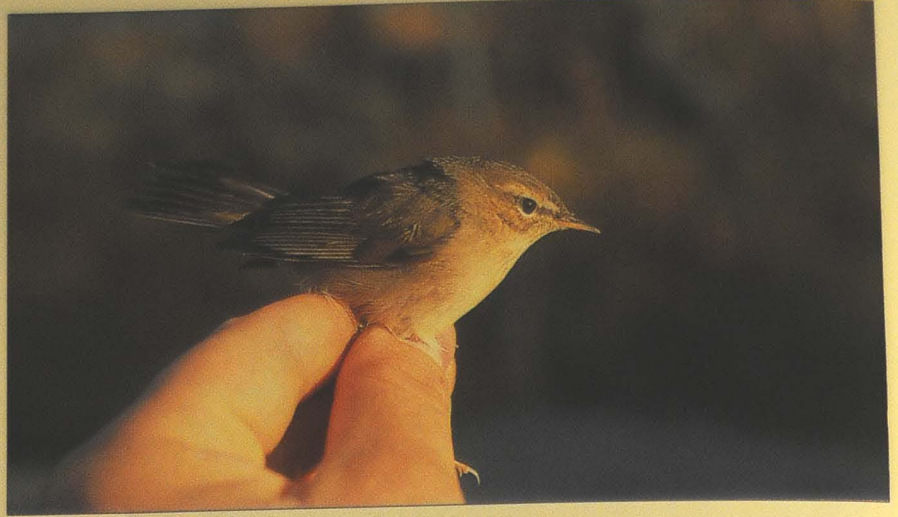
Haliaksella päästiin ihastelemaan ruskounilintua ( Phylloscopus fuscatus ).

Valkoselkätikkoja havaittiin syksyn aikana yhteensä hurjat 9 muuttavaa ja 5 paikallista. Niitä rengastettiin yhteensä 6, joista kolme 15.10. Rengastetuista linnuista 5 oli nuoria naaraita ja yksi nuori koiras. Ensimmäi-