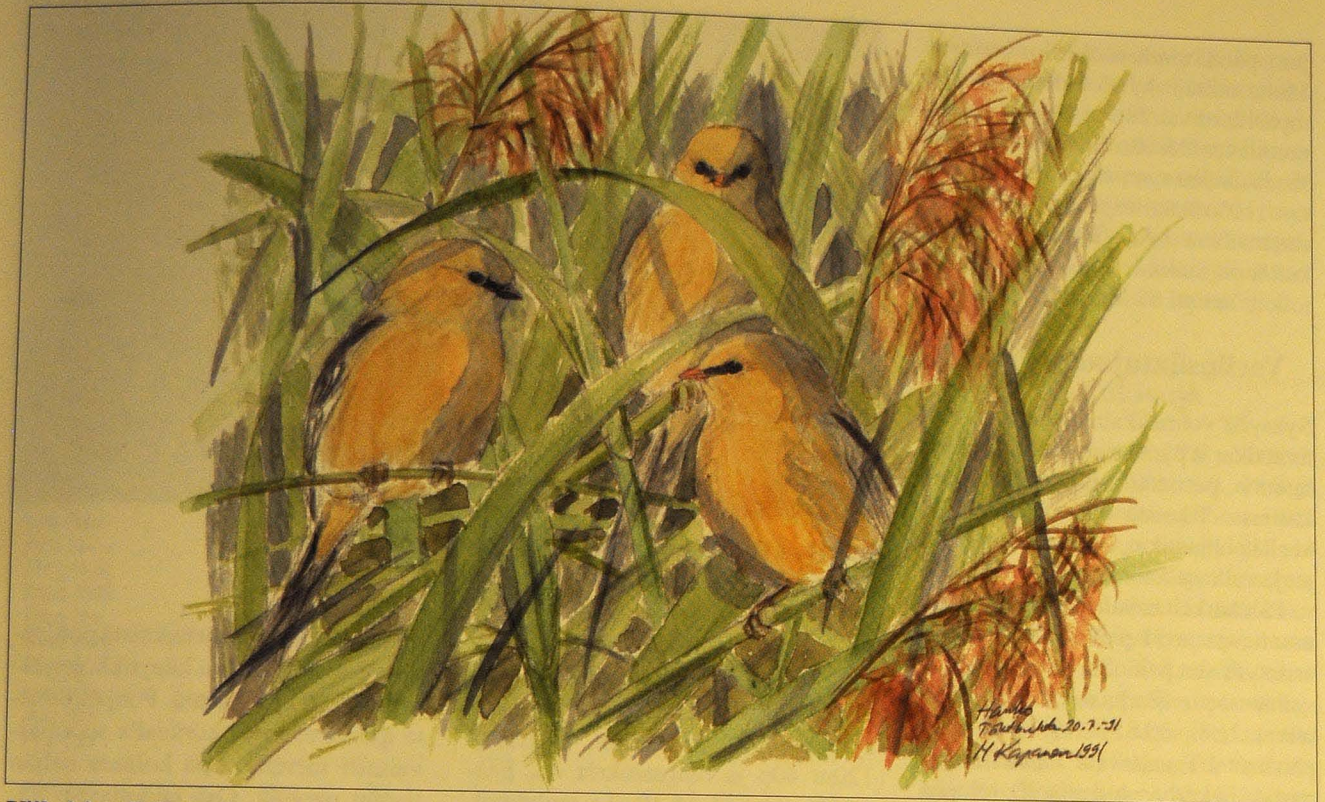
Viiksitimali ( Panurus biarmicus ) tavattiin Haliaksella syksyn aikana kahdesti. Nämä timalinuorukaiset varttuivat Hangon Täktbuktenin ruovikossa.

Nokkavarpusia muutti kevään aikana yhteensä 4 ja pohjansirkku havaittiin 8.5.