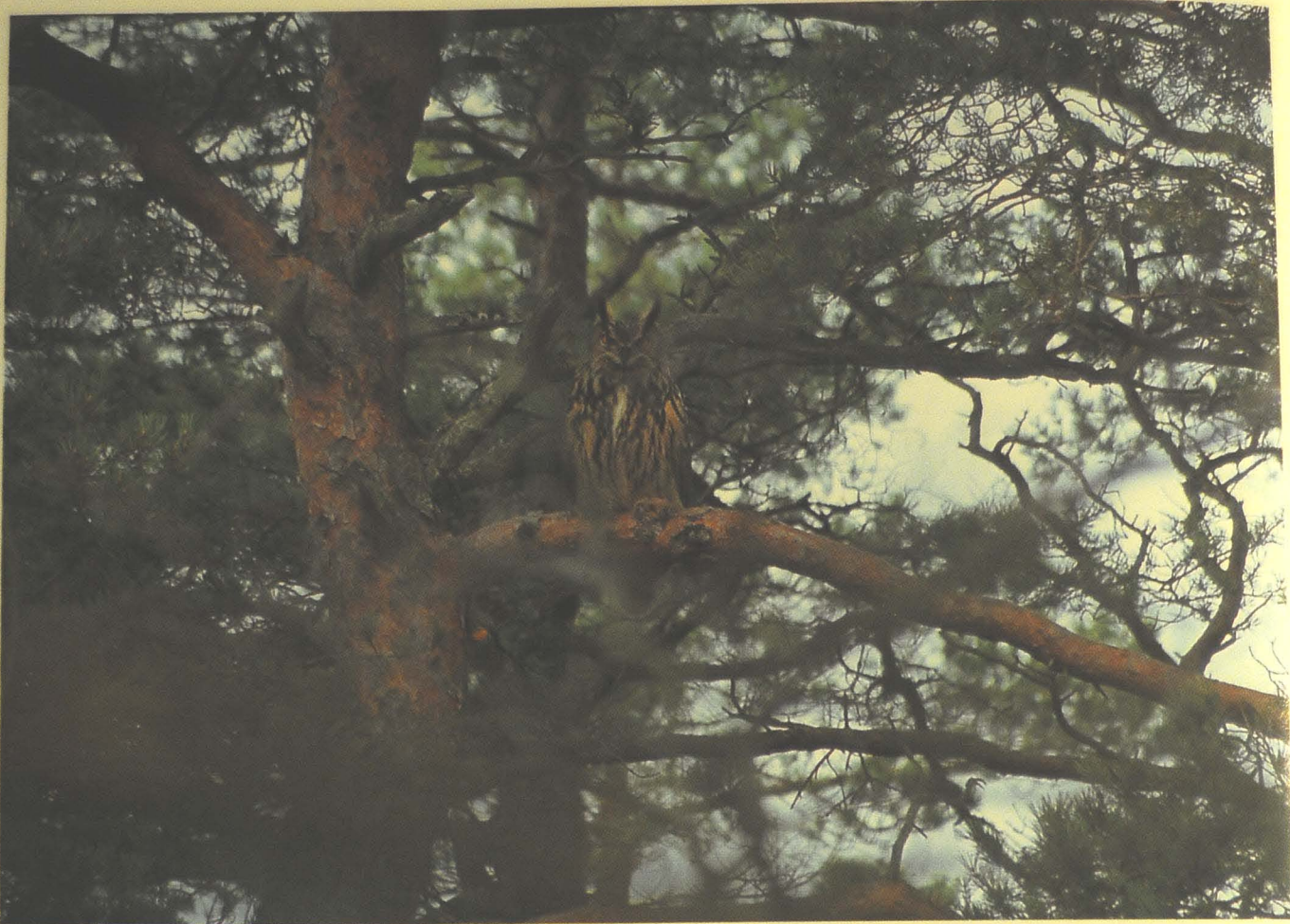
Huuhkaja Bubo bubo seikkaili aseman alueella syksyllä ja piti niemen jäniskantaa kauhun vallassa.

Ip 15.11. ja /5 allihaahkaa 30.11. . Vitkuttelijoita havaittiin seuraavasti: hernekerttu 30.10. , lehtokerttu ja metsäkivinen 2.-3.11. , merihanhi 5.11. , kaksi laulurastasta 3.12. sekä kangaskiuru ja mustapääkerttu 5.12.