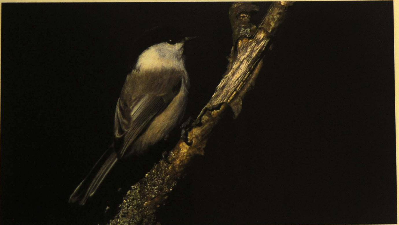
Tiaisten määrät ovat Haliaksella omaa luokkaansa. Kuvassa hömötiainen Parus montanus . © Pekka Komi, Kirkkonummi, lokakuu 2001.

Muuttokauden huipentuman, päämuuton tai massamuuton, ajoittuminen on tietenkin lajikohtaista ja monien lajien muuton huiput osataan ennakoida sääolojen mukaan. Esimerkiksi etelän ja lounaan välille kääntyvä tuuli noin 20. päivä toukokuuta povaa valkuposkiahkien muuttorynnistystä Suomenlahdella