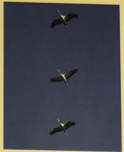
Kurkia Grus grus komeat 8766 (159a).

vas täynnä kurkiparvia. Kurkia tuntui olevan joka puolella. Parvia oli paljon ja aika pieniä (vrt. eilinen). Pahin kurkihelvetti oli 10:30-12:30. Parissa tunnissa meni 5410 kurkea. Olihan menoa. Muutto hiipui heti yhden jälkeen. Päivän summa oli uusi Haliasenkka 8766 (159a) lintua. Iltapäivällä tosiaan vain pari parvea. Kahdessa päivässä n.16 000 kurkea. Repikää siitä huumoria.