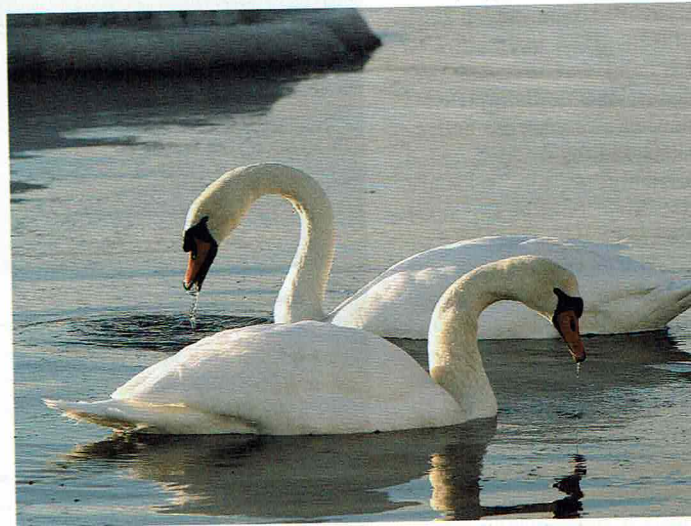
Kyhmyjoutsen Cygnus olor paransi kevään muuttoennätystään. Below, 13.1.2003.

Maaliskuu oli koko kevään selvästi normaalia lämpimä. Poikkeuksellisen aikaisia saavutuksia havaittiin mm. valkuposkiha (yks.) 7.3., kuovi 13.3., kapu 14.3., mustaleppälintu 22.3., lintu 28.3 sekä viitasirkkalintu Haliaksen muuttoennätyksiä neltiin mm. seuraavasti: kyhmyjoutsen 25.3. 53m, suokukko 5.5. mustalintu 11.5. 5 890m ja m... 11.5. 41m. Kurkia havaittiin aikana ennätykselliset 5 900 vaa ja yli tuhannen linnun nähtiin kolmesti, parhaimpana 1 260m.