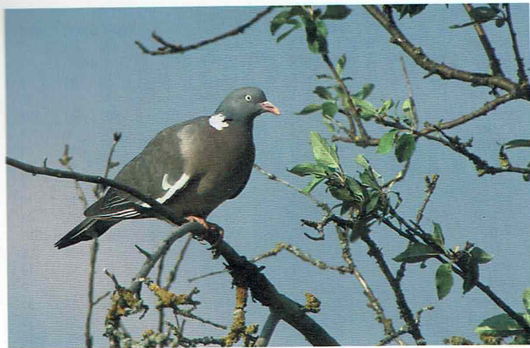
Sepelkyhkyjä Columba palumbus ynnättiin liki 60 000, mikä on enemmän kuin viime vuosina on totuttu. © Pekka Komi, heinäkuu 2003.

kana nähtiin myös ennätysmäärä merihanhia (924m), harmaahaikaroita (336m) ja uuttukyhkyjä (1 080m).