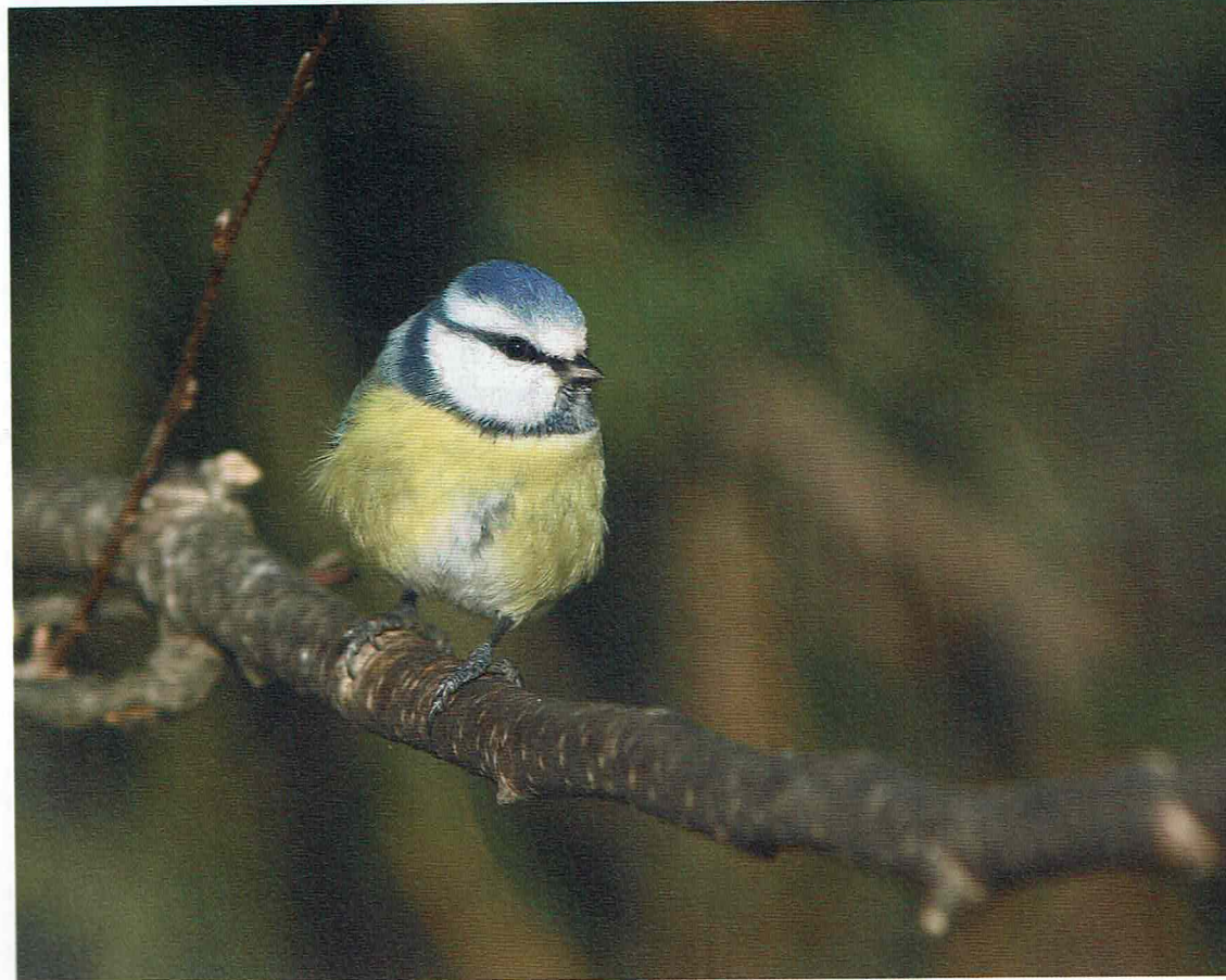
Sinitiaisia Parus caeruleus vaelsi liki 20 000 yksilöä niemen yli syksyn aikana.

Nuori jääkuikka yllätti ylilenmol 8.9. samoin kuin aikainen allihaa 13.8. Sirosohaukka piipahti nie yllä 16.8. Muuttohaukkoja näh