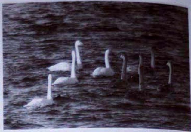
Talvella 1964 Haliaksen alueella oli runsaasti joutsenia Cygnus cygnus.