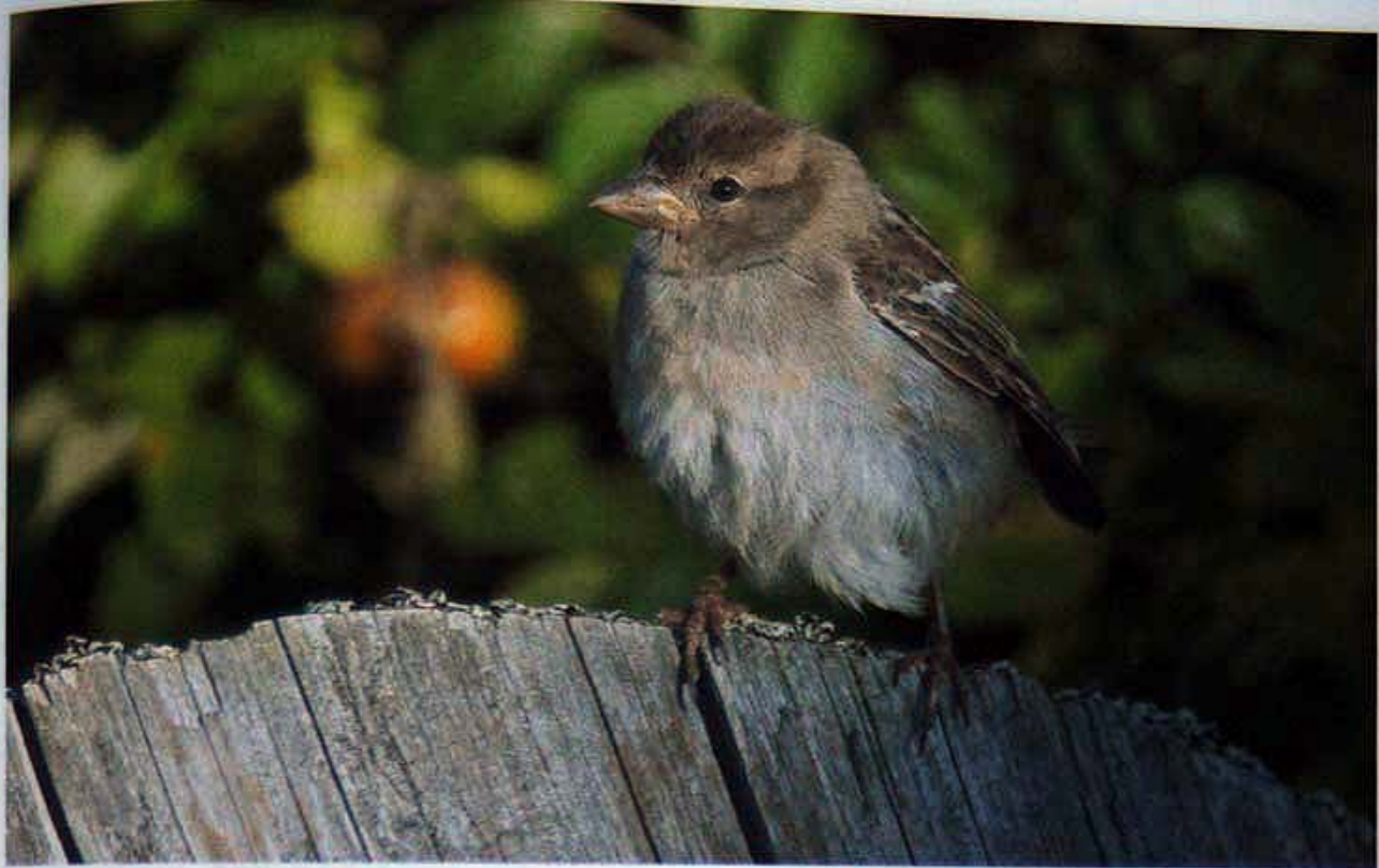
Varpusella Passer domesticus oli melkoisia muuttoja 1970-luvulla. Tulevaisuudessa näyttää siltä, että varpusta joutuu haeskelemaan saadakseen edes lajin vuodenpinnaksi.