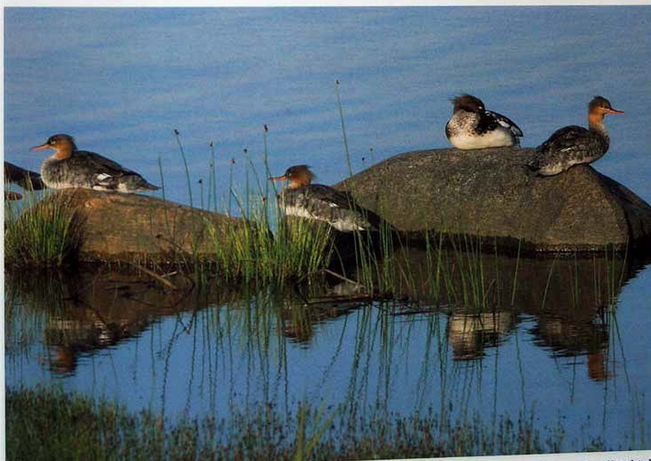
Haliaksen hyviin talvilajeihin lasketaan mm. tukkakoskelo Mergus serrator, joita muualla Tringan alueella ei talvisin juuri ole tavattu.