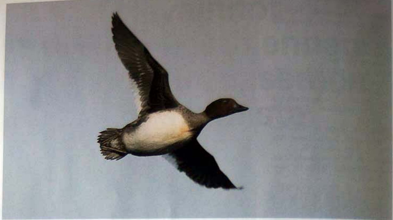
Telkkä Bucephala clangula on ollut Haliaksella tuttu näky jo vuosikymmenten ajan ja talvella lajin tapaa melkoi- sella varmuudella, jos avovettä on jäljellä. © Juha Saari, Espoo, 3.8.2004.