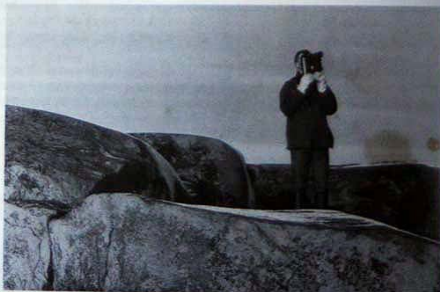
Havainnointia Haliaksen kallioilla 1960-luvulla.