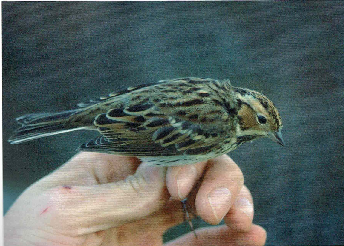
Pikkusirkku Emberiza pusilla tarrasi verkkoon 25.10.2004.