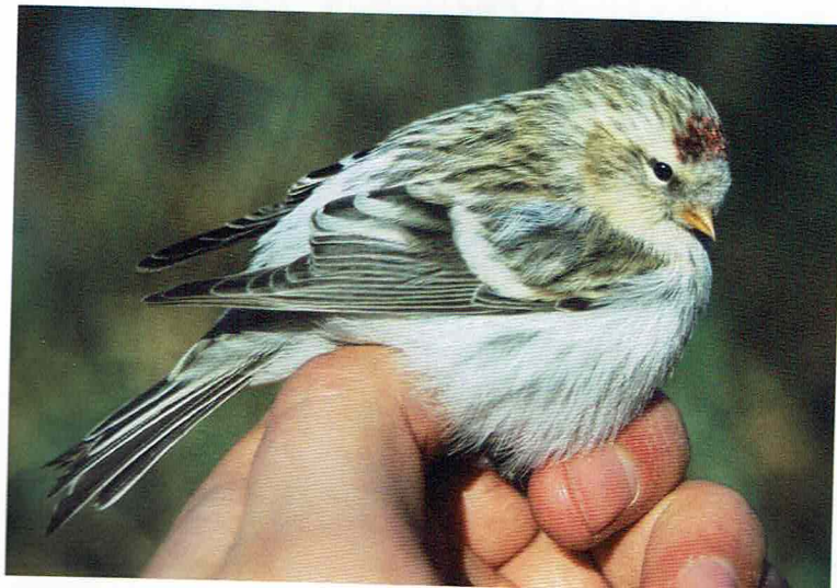
Tundraurpiaisia Carduelis hornemanni nähtiin myös vain kaksi syksyllä 2004.

Syksy oli vaelluslintujen osalta keskinkertainen. Tikkoja, tilhiä (ks. yllä), tiaisia ja käpylintuja oli hyvin liikkeellä. Tikoista harmaapäätikalalla (n.14 yks., joista 2r), pikkutikalla (208m 53p 15r), pohjantikalla (64m 17p 11r) ja palokärjellä (105m 35r) oli hyvä vaellus. Käpytikat liikehtivät kohtalaisesti heinä-elokuussa