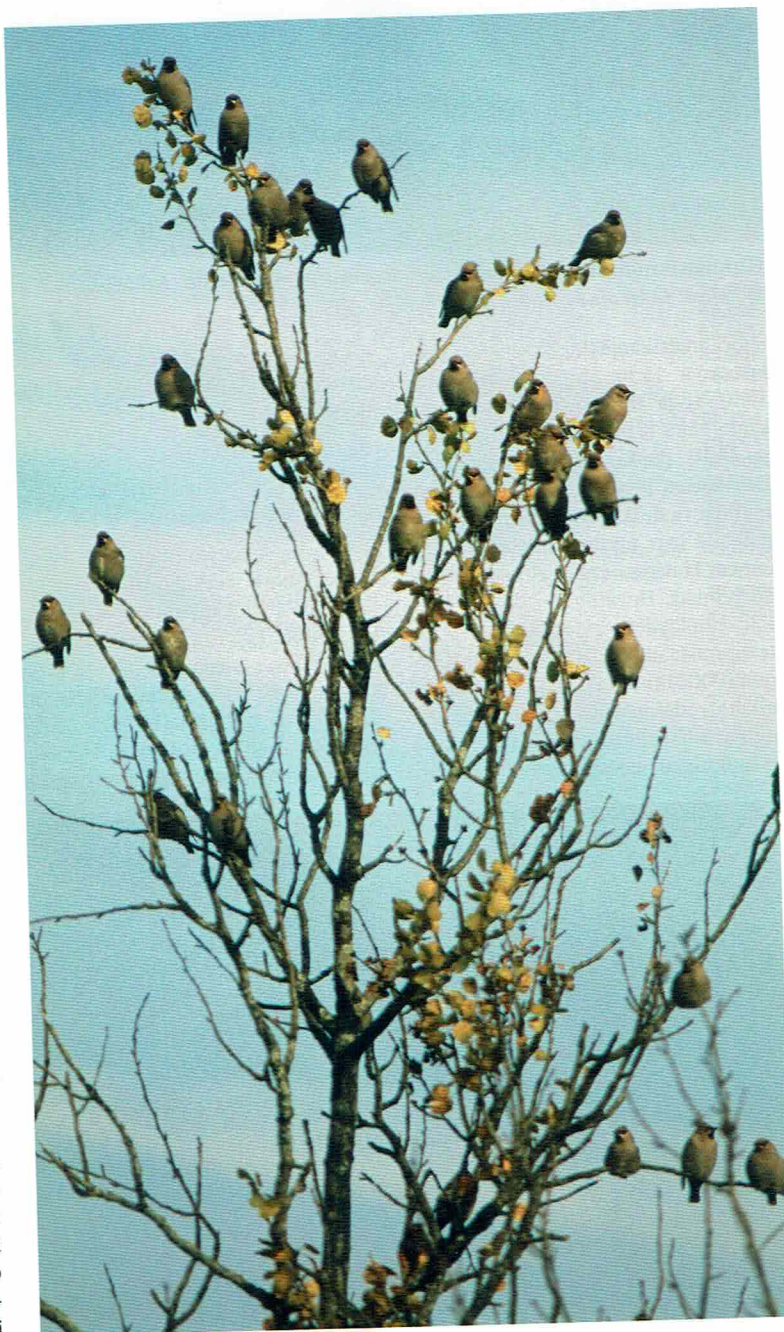
Tilhellä Bombycilla garrulus oli huippuvaellus ja sirsijöitä ynnättiin yli 46 000 yksilöä.

sä arviolta 22 yksilöä. Muita syksyn harvinaisuuksia olivat kirjokerttu 12.8., nuoret tunturikihiut 29.8. ja 14.9., niittysuohaukka 29.8., isokirvinen 31.8. haarahaukka 4. ja 8.9., punajalkahaukka 11.9., taigauunilintu 15.9., kiljukotkalaji 16.9., heinäkurppa 1.10., tunturikiuruja 9.–29.10. yht. 7m1p, yömuuttavia kaulushaikoita 11.10. Iyöm ja 20.10. 2(2a) yöm,