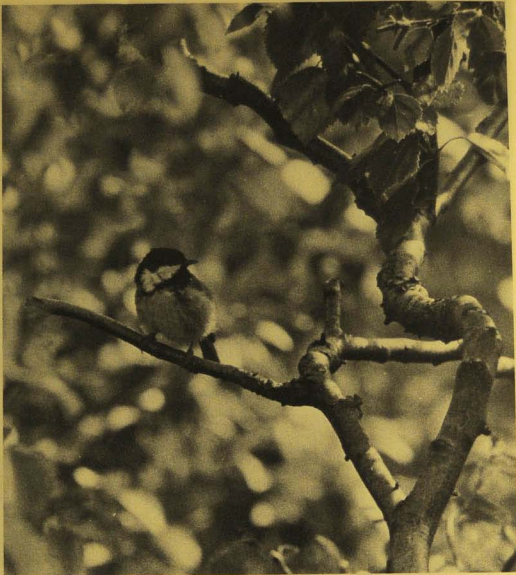
Kuusitiaisen pääjoukot tulivat Haliakselle tavallista myöhemmin.

Vaelluslinnuista esiintyivät tänä syksynä runsaina kuusitiainen, talitiainen ja pöllöt. Kuusitiainen yllätti runsaudellaan ja aikaisempia vuosiä myöhempään ajoittuneella muutol-