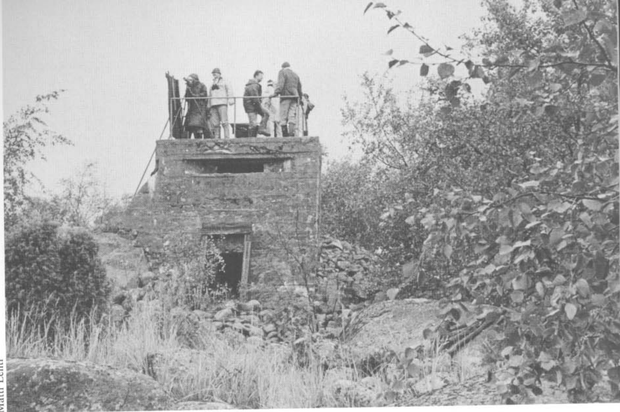
Haliaksen bunkkerilla ei juuri tarvitse tyhjää taivaanranta tuijotella, katseltavaa riittää aina.

epäarvokkaan näköisenä yrittäen seurata mahdollisimman tarkasti jokaista parven kaarosta tai liikettä. Kun parvi pääsi tarpeeksi korkealle ja jatkoi matkaa, merihanhi otti oman paikkansa ja seurasi parven mukana.