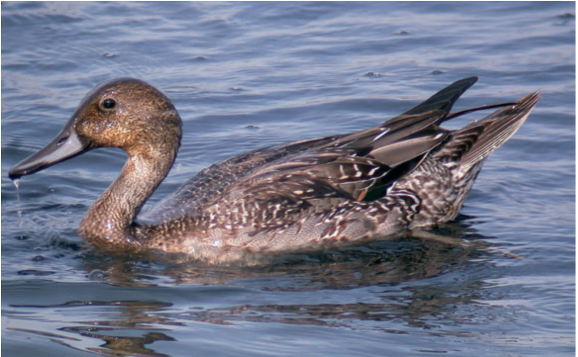
Vastaavasti, ankaraa talvea ilmentävien NAO-indeksien jälkeisinä keväinä jousisorsat saapuivat myöhään. © Pekka J. Nikander, Espoo, lokakuu 2003 (digiscoping).

Amerikassa. Suhteellisen leudot talvemme johtuvat Golf-virrasta, joka kuljetttaa tropiikissa lämmennytä Atlantin valtameren vettä Länsi-Euroopan rannikolle. Läntisten tuulien kuljettama Atlantin päällä lämmennyt ilma vastaa leudoista talvistamme. Pohjois-Atlantin ilmastojärjestelmä säätelee lämpimän ilman virtaamista Euroopan ylle. Pohjois-Atlantin ilmastojärjestelmän vaihtelut (North Atlantic Oscillation = NAO) heijastuvat Pohjois-Euroopan talvien ankaruuteen. Tuon ilmastojärjestelmän vaihtelua arvioidaan usein joulumaaliskuun keskimääräisten ilmapaineiden eroilla Islannin matalapainekeskuksen ja Azorien korkeapainekeskuksen välillä. Kun ilmapaine-erot suhteutetaan niiden pitkäaikaiseen keskiarvoon voidaan talvien välistä ilmastovaihtelua kuvata yhdellä ainoalla luvulla, NAO-indeksillä. Kun talvea hallitsevat läntiset tuulet, jotka kuljettavat lämmintä ja kosteaa ilmaa Atlantilta Pohjois-Euroopan ylle, NAO-indeksi on positiivinen ja talvi leuto. Vastaavasti pohjoisen puoleisten tuulien vallitessa Pohjois-Eurooppaan virtaa kylmää