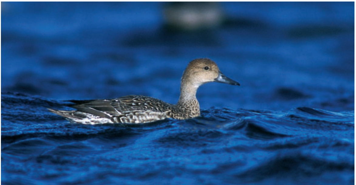
Jouhisorsan muuton ajoitus ja ilmaston lämpeneminen korreloivat keskenään. © Pekka Komi, lokakuu 2002.