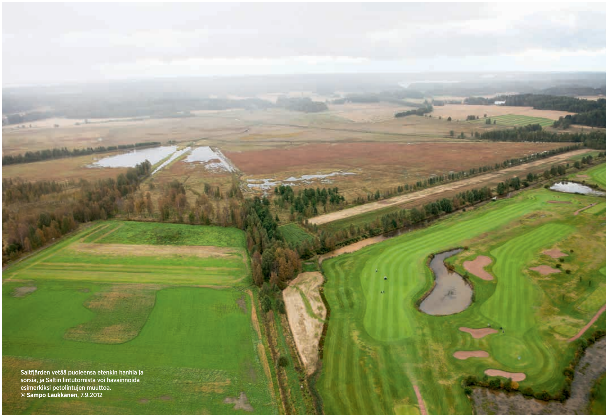
Saltjärden vetää puoleensa etenkin hanhia ja sorsia, ja Saltin lintutornista voi havainnoida esimerkiksi petolintujen muuttoa. © Sampo Laukkanen, 7.9.2012