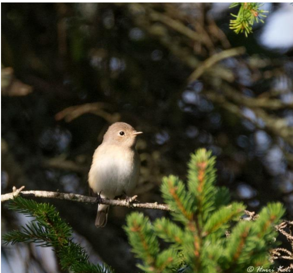
Pikkusieppo Ristnassa.