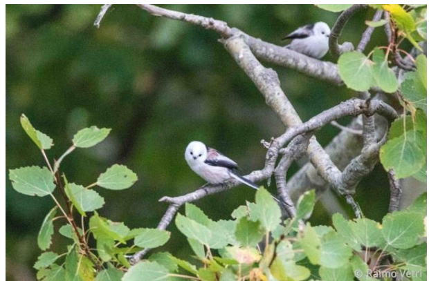
Pyrstötaiset olivat liikkeellä suurin joukoin syksyllä 2016.

Paikallisena lepäili runsas joukko merisorsia ja puolisukeltajia. Määrältään runsain oli telkkä , joita lepäili yhteensä tuhatkunta yksilöä merialueella. Toiseksi tuli alli 350:llä yksilöllä. Muita lajeja olivat tukka- ja isokoskelo , punasotka , jouhisorsa , tavi ja haapana . Kova tuuli painoi niemelle tulevat pikkulinnut matalalle, pääosa pikkulinnuista koostui tänä vuonna pyrstötaiaisista joita laskettiin aamun aikana yli kolmesataa yksilöä. Pyrstötaisten vanavedessä merelle yritti kuusitaisia , sini- ja talitaisia sekä vähemmässä määrin myös hömötaisia .