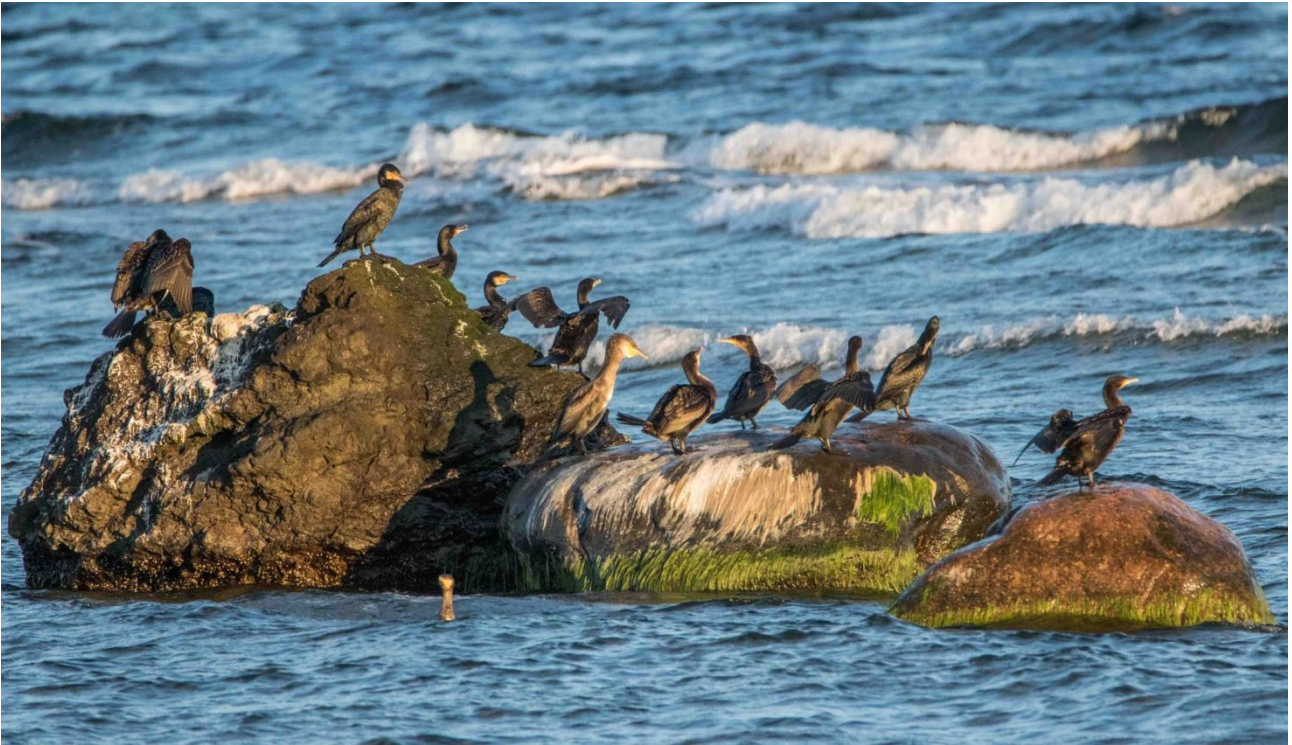
Merimetsoja kuivattelemassa jäätikön tuomilla kivillä Paldiskin edustalla.