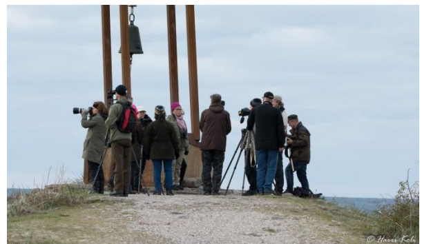
Staijaajat Tahkunassa Estonian uppoamisen muistomerkillä. – Valok. Harri Koli.