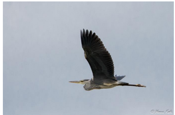
Harmaahaikara oli jalohaikaraa huomattavasti harvalukuisempi Hiidenmaalla.

illallisella odotti paikallista syksyn satoa, eli villisikaa joka olikin erinomaisesti laitettua. Päivän lajimäärä kohosi 84:ään.