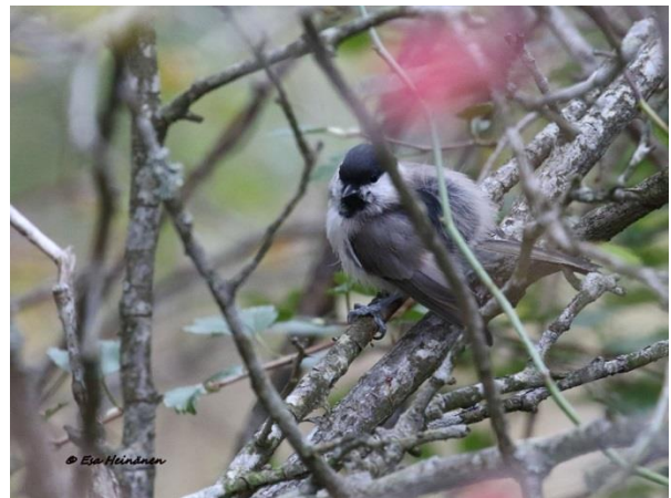
Viitaiainen puskissa, lintuja nähtiin tavallista enemmän retken aikana.