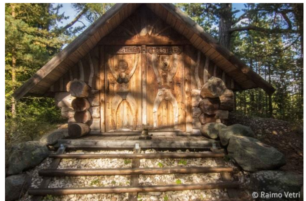
Ninalaidin vessa ei tarvinnut enempää selityksiä. – Valok. Raimo Vetri.

muutonseurantapaikka. Keväällä täällä lepäilee tuhansia haahkoja ja alleja.