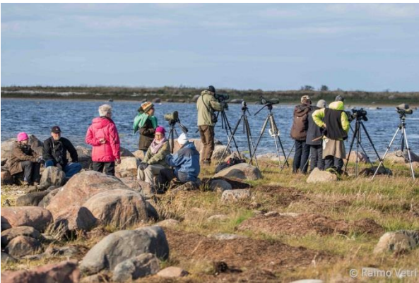
Ninalaidin kärjessä tauolla.

Iltapäivän kävely suoritettiin Ninalaidissa, jossa pääsi lähestymään muutamia niemen edustalla olevia saaria. Laajoilla lietteillä tepasteli kaksi tundrakurmitsaa ja viisitoista töyhtöhyppää . Vesilinnuista runsain oli lapasorsa viidelläkymmenellä yksilöllä.