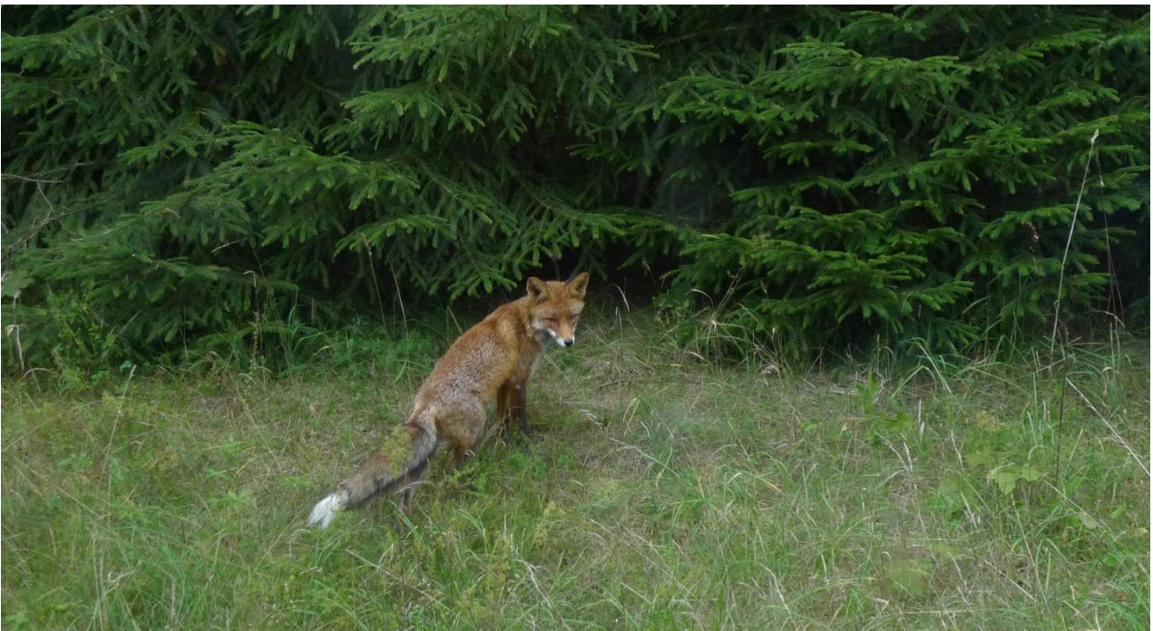
Kettu kuvattuna bussin ikkunan takaa, jossain päin Hiidenmaan teitä.