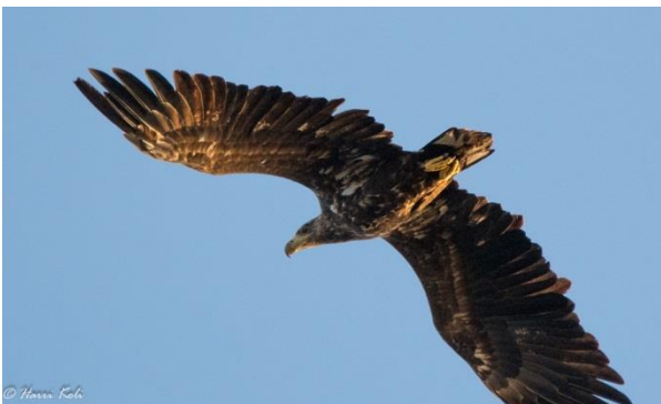
Merikotkia liihotteli useampia niemen yllä.

Perjantai 23.9. Aamun runsaan aamiaisbuffetin siivittäminä suuntasimme läheiselle Pöösaspean havaintopaikalle muutonseurantaan. Vesilintuja oli liikkeellä vähänlaisesti, lähinnä kaakkureita ja kuikkia , joita havaittiin yhteensä 170 muutolla. Kuikkalinnut tulivat usein aivan suoraan päältä, jolloin lajiparin määritykseen on vain silmänräpäys aikaa.