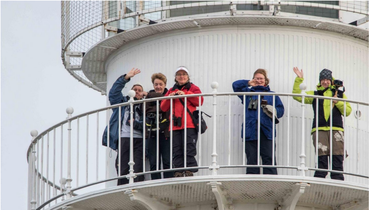
Retkeläiset Tahkunan majakan huipulla.

Tahkunassa merkittävin lintuhavainto oli nuori ristisorsa , joka saapui lahdelle lännestä. Harvoin nähty laji syysretkillä. Muuta lajistoa olivat 16 muuttavaa sepelhanhea , sata merimetsoa ja seitsemän harmaahaikaraa . Iltaa vasten palasimme majapaikkaamme Kõpun niemelle. Saunan jälkeen saimme paistettuja kampeloita ja vielä makoisaa jälkiruokaa. Iltahuudossa lajimääräksi tälle päivälle saatiin 76.