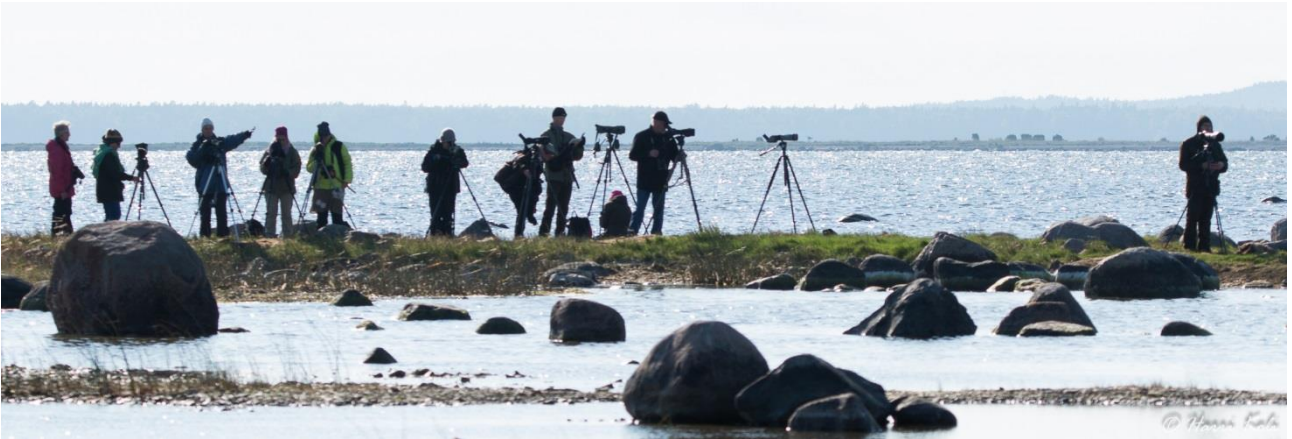
Havainnointia Kõrgessaaren rannoilla Hiidenmaalla.