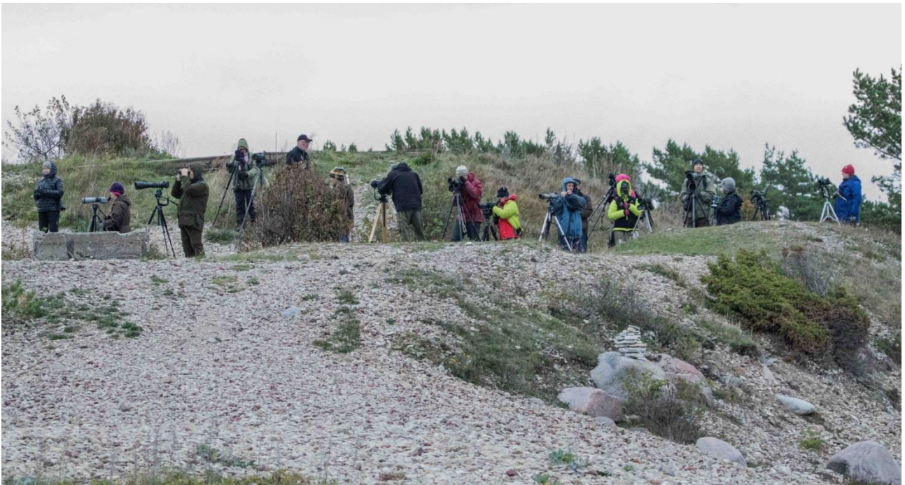
Havainnointia Ristnan niemellä.

Myös Ristnan rannoilla riitti nähtävää. Kauempana havaittiin kahlaajaparvi jota lähdimme varovaisesti lähestymään. Jo kauempaa parvesta määritettiin tundrakurmitsa ja kapustarinta . Kuirimainen lintu jäi kuitenkin kaihertamaan mieltä. Ei auttanut muuta kuin päästä tarpeeksi lähelle lintujen määrittämiseksi. Matkalla rannalle havaittiin kaksi kangaskiurua , nyt useampia ehti havaita lajin. Vartin tarpomisen jälkeen kuirilintu varmistui kuoviksi, helkkari sentään näytti niin kuirilta kauempaa! Parvessa oli myös viisi kapustarintaa , suokukko ja kauempaa vielä erottui pari todennäköistä suosirriä . Hyvä lajiparvi!