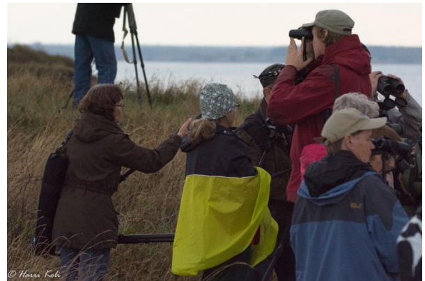
Lintujen havainnointia Paldiskin kallioilla.

pysyttelemään matalalla, sillä kova tuuli olisi muuten painanut linnut taivaan tuuliin.