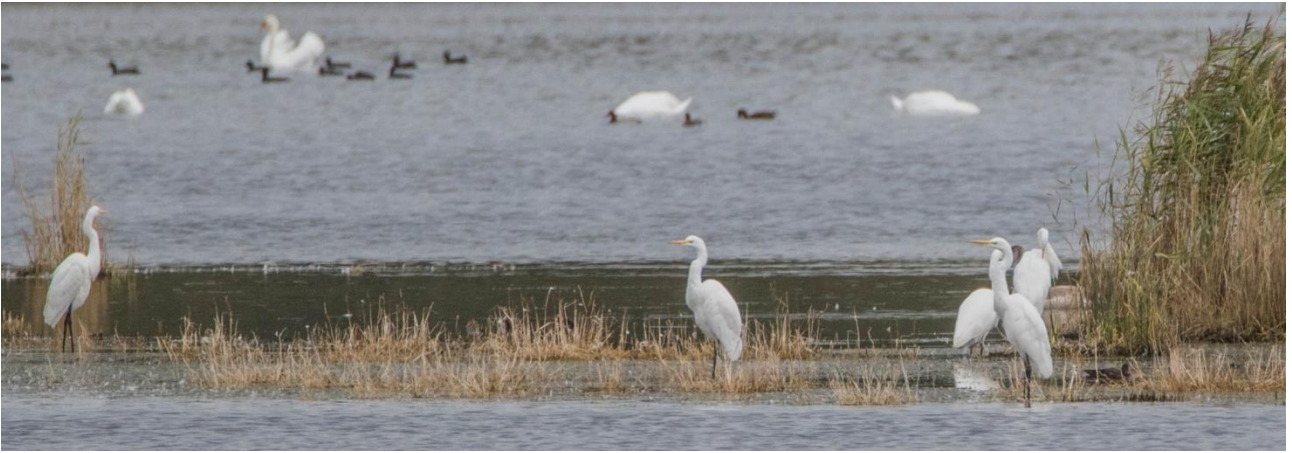
Jalohaikaroita havaittiin Käinalahdella yhteensä 144 yksilöä.

Lintumäärät kasvoivat oleellisesti siirryttäessä varsinaiselle Käinalahden lintutornille, joka on kuvattuna tämän raportin ensimmäisellä sivulla. Käinalahti kerää tosiaan erinomaisen hyvin saarelle tulevat vesilinnut. Lintujen määrät, erityisesti eräiden Suomessa harvalukuisempien lajien määrät olivat päätähuimaavia. Esimerkistä käy vaikkapa punasotka , joita laskettiin peräti 1500 yksilöä . Missään päin Suomea ei tuollaisia määriä voi kuvitellakaan näkevänsä! Myös tukkasotkia oli runsaasti, yli 4000 yksilöä. Kyhmyjoutsenia oli samaten paljon, 1800 lintua, nokikanoja 1700 yksilöä ja haapanoita 2000 lintua. Mihin ikinä katsoikaan lahdelle, niin lintujen määrä ja monipuolisuus jaksoivat yllättää. Harvalukuisempia lajeja olivat mm. neljä pikku-uikkua , harmaa- ja jouhisorsia kuusi, merikotkia neljä ja harmaahaikaroita kaksikymmentä.