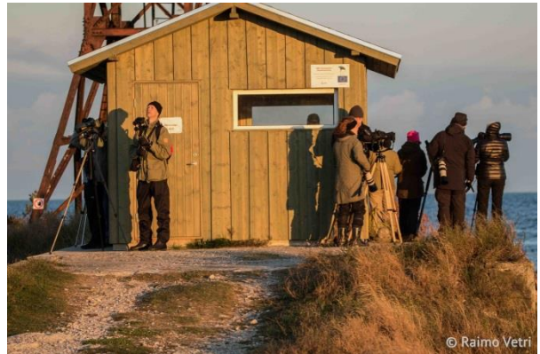
Pöösaspean havaintoasema antaa tuulensuojaa avoimessa niemenkärjessä.

sepelhanhi , joita oli kolme yksilöä lepäilemässä rannalla.