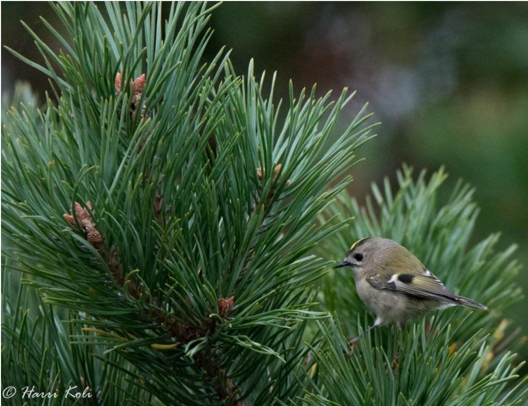
Hippiäinen etsimässä evästä männyn oksasta.