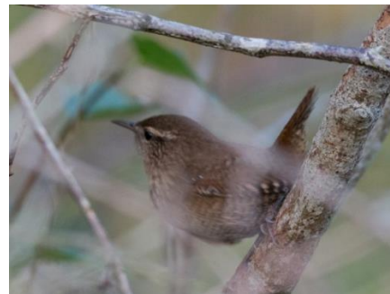
Peukaloisia kähmi useampia Ristnan kärjessä.

Katseemme suuntautuivat tänään ennemminkin suoraan yläpuolellemme. Tiaisilla oli tänään selkeästi muuttoa päällä. Sinitiaisia muutti 700, kuusitiaisia 150, talitiaisia 100 sekä pyrstötiaisia 50. Lähempänä metsänrajaa liikkui muutama viitatiainen ja näkipä joku onnekas myös pikkusiepon .