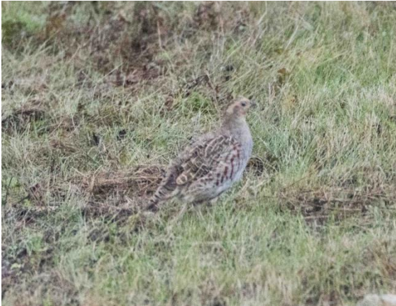
Peltopyy kuvattuna bussin ikkunan läpi.

Illan hämärtyessä ajoimme majapaikkaamme Dirhamin satamaan Pöösaspean niemen kupeeseen. Illalla nautimme mahtavan lohisopan mahtavan yötaivaan alla.