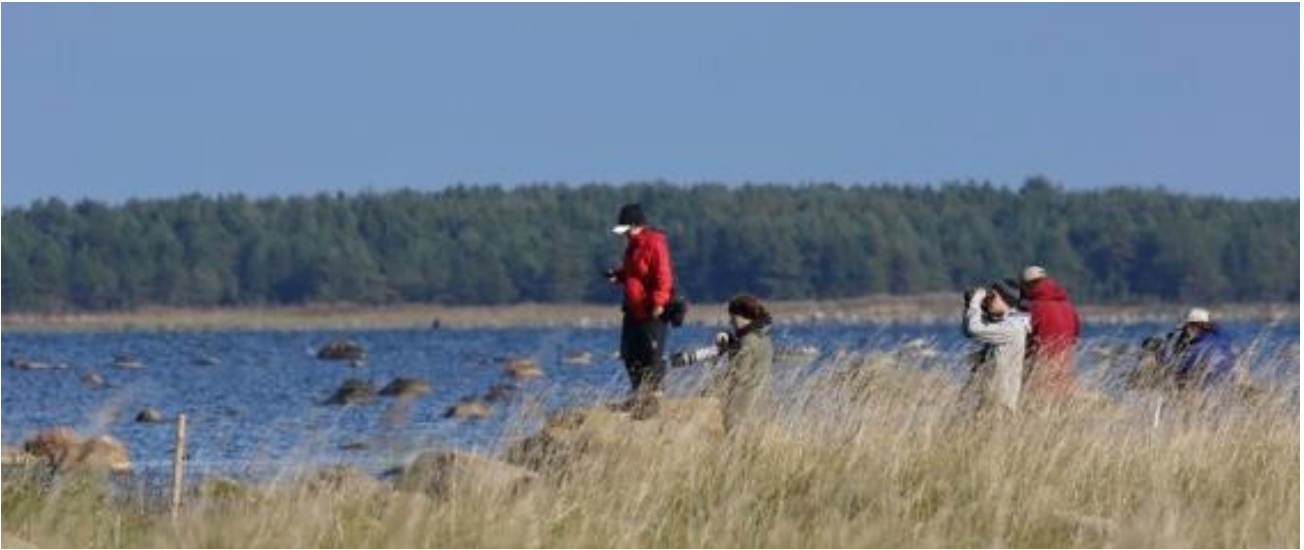
Luidjan lahden matalia rantoja koluamassa.

Iltapäivän kävely suoritettiin Ninalaidissa, jossa pääsi lähestymään muutamia niemen edustalla olevia saaria. Laajoilla lietteillä tepasteli kaksi tundrakurmitsaa ja viisitoista töyhtöhyppää . Vesilinnuista runsain oli lapasorsa viidelläkymmenellä yksilöllä.