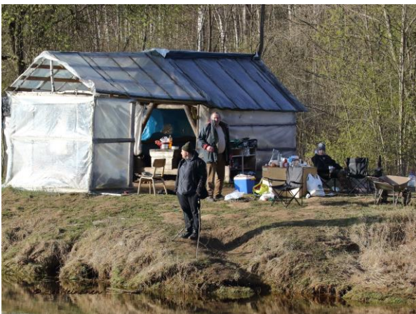
Kalastajien vaatimaton leiri joen töyräällä.