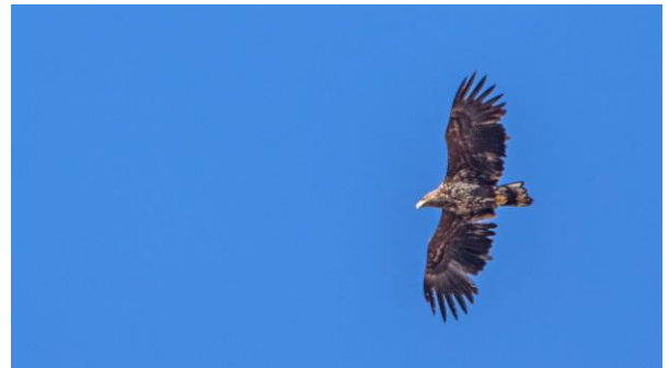
Esiakuinen räsymatto, eli merikotka.