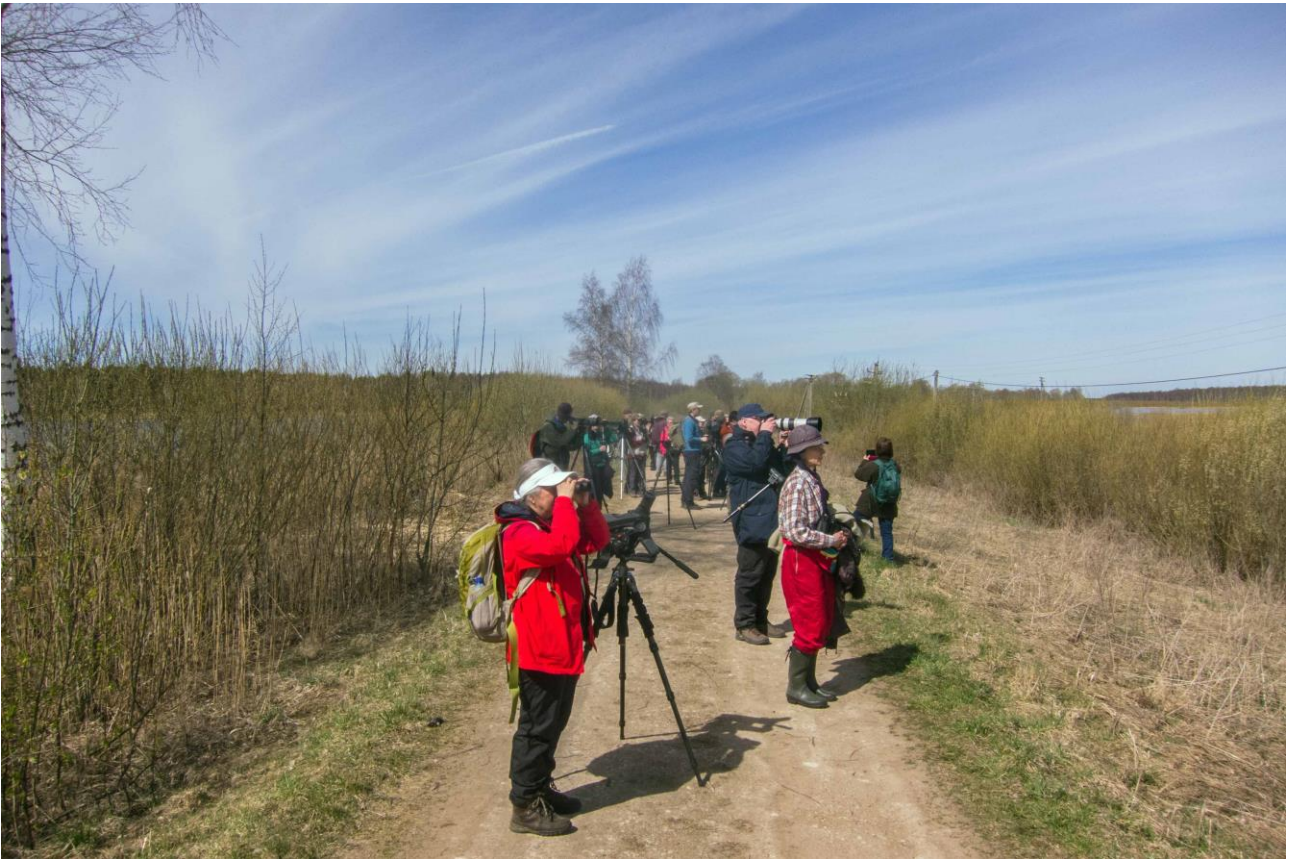
Ilmatsalun kala-altailla riitti katseltavaa.

Päivän kääntyessä ehtoon puolelle palasimme kuuden aikaan majataloomme. Illallisen jälkeen päivän lajimääräksi saatiin huikeat 106.