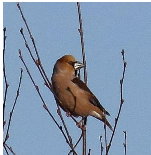
Nokkanisse Jägalassa.

Viron levein vesiputous. Bussin jätettyä meidät vähän matkan päähän tienristeykseen, jatkoimme jalan hiekkatietä joen rantaan.