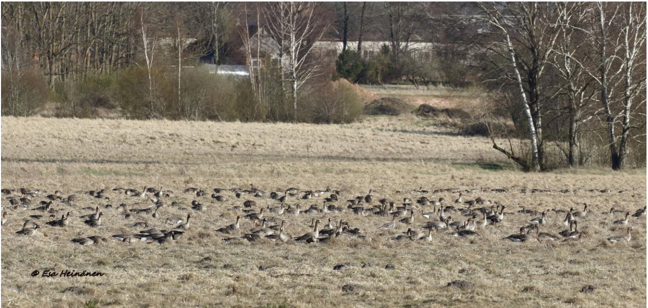
Tundrahamhia Aardlupalun laitamilla.

Perjantai 5.5. Aikaisen aamiaisen jälkeen oli aika tutustua Ilmatsalun lintutarjontaan. Aamu aloitettiin motellin pihasta ja tien toisella puolella sijaitsevasta puistosta. Lintuja oli edelliseen kevääseen verrattuna vähemmän äänessä, mutta paikalla oli toki nokkavarpusia , sirittäjä , pähkinänakkeli ja odotetusti mustaleppälintuja , tällä kertaa herran ja rouvan vahvuudella.