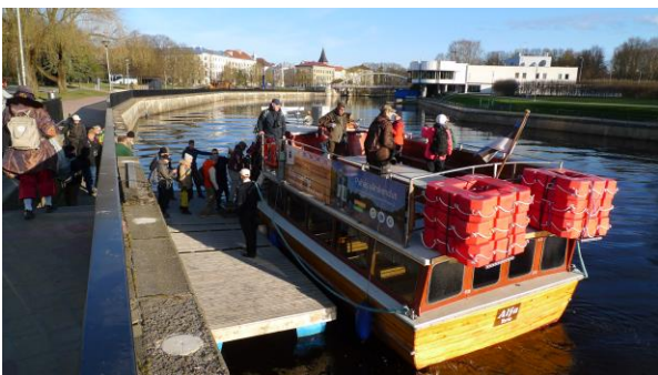
Väen lastaus jokiveneeseen.

Sunnuntai 7.5. Viimeinen aamu valkeni Ilmatsalussa rauhallisesti. Aamiaisen ja huoneiden luovutuksen jälkeen Valvo vei meidät Tarton kauppahallin viereen, Emajoen rannelle, josta jokiveneemme poimisi meidät kyytiinsä. Matka veisi meidät Emajokea pitkin aina Vörtsjärvelle.