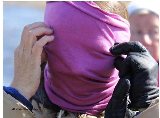
Liika lintuja.