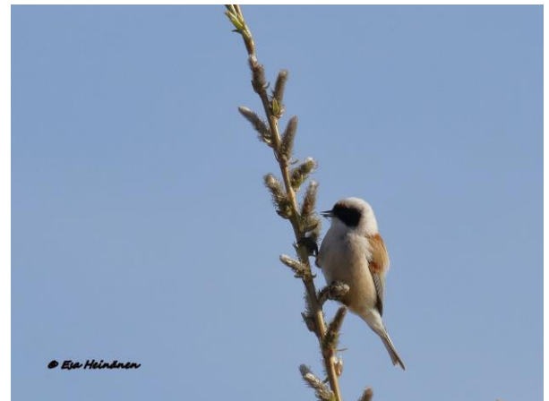
Pussitiainen on yleinen Aardlapalun pajukoissa.

varsin piakkoin järven lintutornille, tarkemmin sen tuntumaan sillä torni itsessään on lahoamiskunnossa.