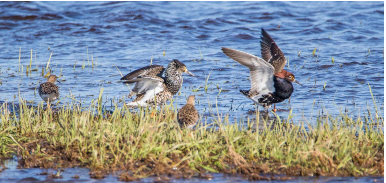
Suokukkoja Emajoen rantamilla.