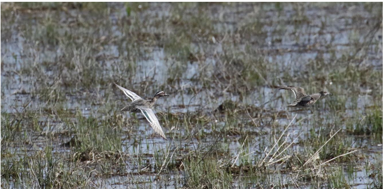
Heinätavipariskunta liikkeellä. Jokimatalla heinätaveja nähtiin peräti 18 yksilöä.