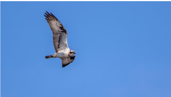
Kalasääskiä saalisteli useita kalarikkaissa vesissä.