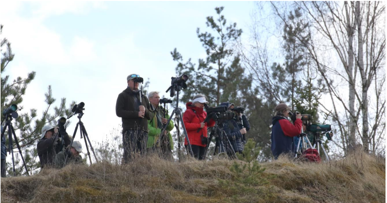
Staijausta Hollywoodin laella.

Perillä Vörtsjärvellä meillä oli hetki aikaa hengähtää ja ihailla Viron toiseksi suurinta järveä. Sattumalta satamassa oli puinen korkea lintutorni, josta vasta olikin hyvät näkymät järvelle. Ensimmäisenä uutena lajina saatiin uivelopari joka uiskenteli tukkasotkien seurassa. Järvellä oli muuten hiljaista, tosin kova väreily häytti lintujen löytämistä kauempaa järveltä. Rannoilla saalisteli ruskosuohaukka ja pajukosta kuului pussitiaisen korkea kutsuääni. Mielenkiinto kohdistui pian aallonmurtajalle, jossa suokukkojen ja kalatiirojen seurasta löydettiin sisämaassa aina harvinainen pikkutiira , vielä kahden yksilön voimalla. Pian löysimme sieltä myös kolme pikkukuovia , uuden lajin retkelle. Hyvä lintukohde selkeästi!