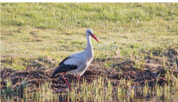
Kuva vasemmalla: kattohaikara joen rantamilla. taise olla jokimatkan ainoa kattohaikara.