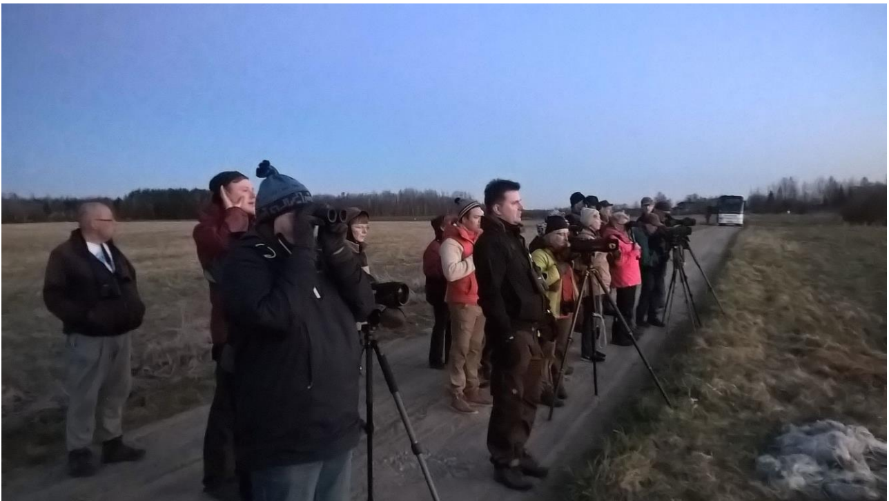
Heinäkurpan kuuntelua Käreveren luhdalla.