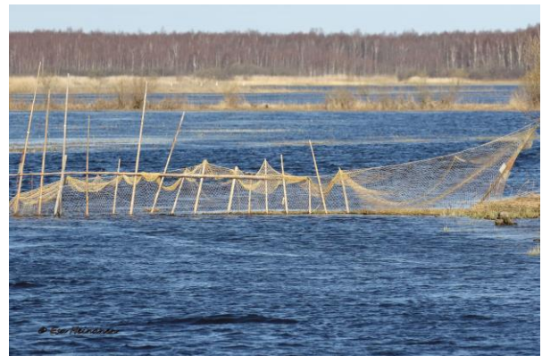
Suuria kalarysiä oli useita matkan varrella.