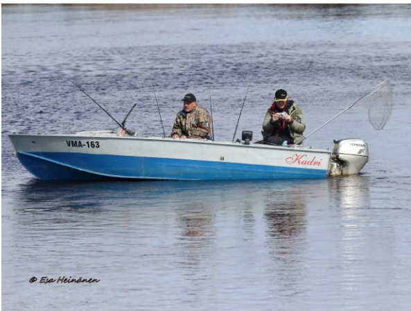
Kalastajilla riitti ihmettelemistä jokilaivassamme, sillä säännöllisiä matkoja tehdään ainoastaan Tartosta Peipsijärvelle.