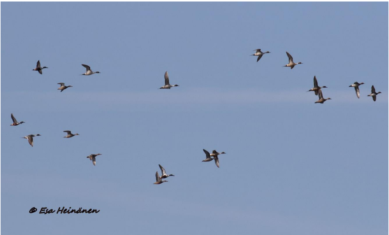
Kuvassa näkyviä jouhisorsia, lapasorsia ja haapanoita lenteli kymmenien lintujen parvissa Emajoella.