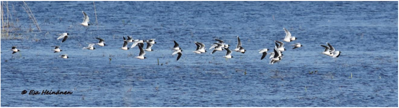
Pikkulokkeja matkalla alajuoksulle.