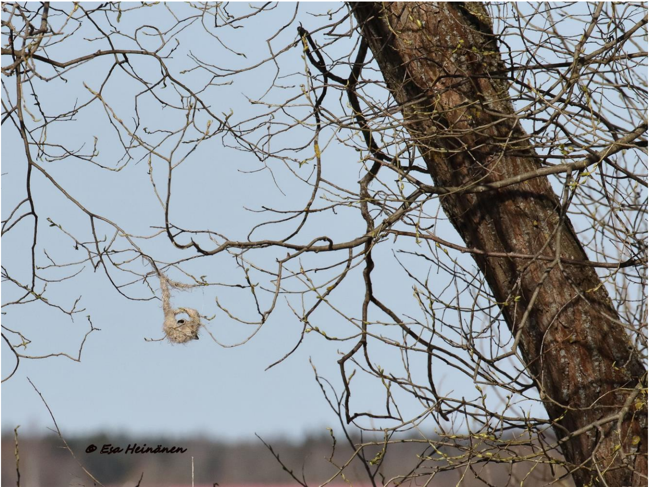
Pussitaiaskoiras rakentamassa pesää, siihen saattaakin upota viikon päivät.