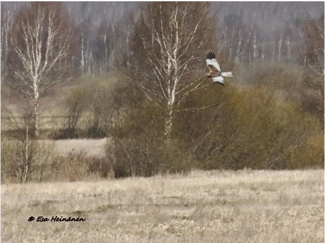
Ruskosuohaukka oli jokapäiväinen näky kosteikoilla.