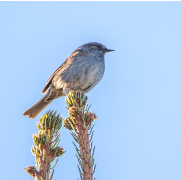
Hiirenharmaa rautiainen Jägalassa.

Ränsistyvien pihojen puissa tiksutteli muutama nokkavarpunen , linnut suostuivat hetken poseeraamaan kameroille ja kaukoputkille. Pihoilla näyttäytyi myös tikli ja keltasirkku . Putouksen töyräälle päästyämme tarkistimme tarkkaan rannat ja niiden puut kuningaskalastajan ja virtavästaräkin toivossa. Molemmat lajit pesivät täällä ja niiden näkemiseen on hyvät mahdollisuudet. Illan aurinko lämmitti joenpenkkaa sen verran, että lämpimän ilman tuomia hyönteisiä jahtasi vilkas pääskyparvi. Kymmeniä haara- ja räystäspääskyjä pyöri ja hyöri joen yllä. Emme tyytyneet lintujen tarkkailuun vain putouksella vaan lähdimme katsastamaan ylävirran lupaavia rantoja.