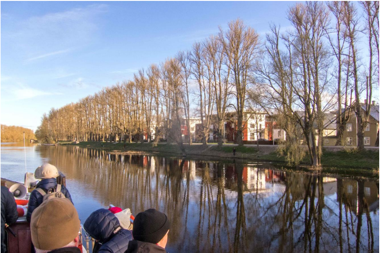
Tarton keskustan puissa oli mustavarisyhdyskunta.