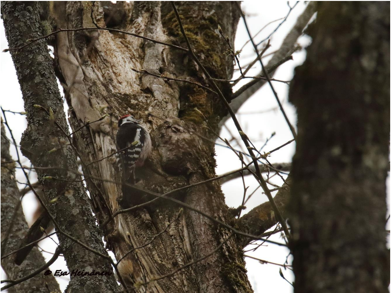
Raadin hautausmaan tammitikka.